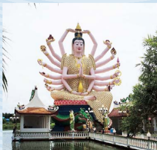
Estatua de Guanyin, diosa de la compasión, localizada en Koh Samui.