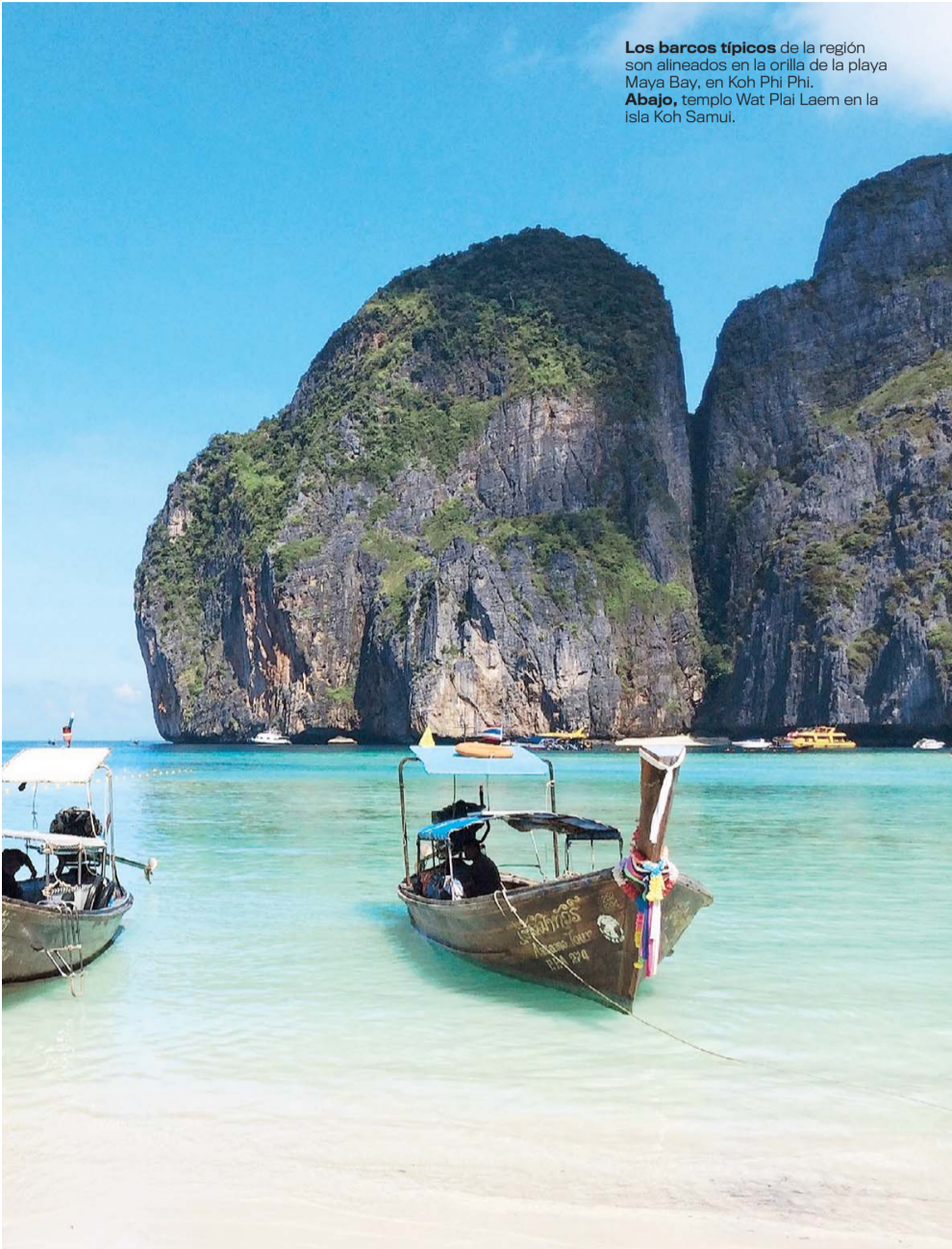
Los barcos típicos de la región son alineados en la orilla de la playa Maya Bay, en Koh Phi Phi. Abajo, templo Wat Plai Laem en la isla Koh Samui.

Tailandia es un país emplazado en el centro de la península de Indochina y localizado en el sureste de Asia. Está rodeado por Laos y Camboya, al este, el golfo de Tailandia y Malasia, al sur, y el mar de Andamán y Birmania al oeste. Tailandia es una monarquía. El país es gobernado por una junta militar que tomó el poder en mayo del 2014.