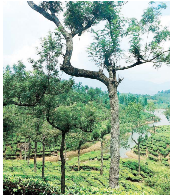
Arriba, el Templo Padmanabhaswamy. Sobre estas líneas, las plantaciones de té de Munnar. Abajo, Playa de Kovalam, Trivandrum.

las mallas de pesca chinas del Fuerte Kochi y ver el atardecer allí es algo que no te puedes perder. También es un lugar excelente para la compra de recuerdos y artesanías, al igual que el pueblo judío, el cual queda a unos diez minutos en auto desde el fuerte Kochi.